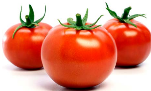
Tabla de modelos Hot/Cold break tomate

En el proceso Cold Break la polimetilestarasa y la poligalacturonasa no son desactivadas, esto es una desventaja para la viscosidad pero es una ventaja para el sabor. El producto obtenido es, por tanto, menos viscoso que el obtenido con la tecnología Hot Break.